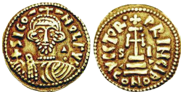
Fig. 1 - Solido di Siconolfo (839-849). D/ SICO NOLFVS; al centro il busto del principe barbuto con corona sormontata da croce, nella destra il globo crucigero; a destra triangolo con globetto. R/ VICTOR• + PRINCIB; al centro croce potenziata su tre gradini, ai lati le lettere S I che sormontano due triangoli; in esergo CONO. ø 22 mm circa; 3,73 g. Bell. 1. Ex asta CNG 67 - lotto 1842

La monetazione longobarda beneventana - a Salerno i successori di Siconolfo sino alla fine del IX secolo coniarono solo denari d'argento - dalla fine dell'VIII secolo era basata su un bimetallismo argento-oro, con denari argentei e solidi aurei (o in alcuni casi, come per Siconolfo, d'elettro: una lega di oro e argento). Nell'XI secolo, invece, si impose nel Meridione un sistema monetale formalmente basato sul bimetallismo rame-oro, con follari di metallo vile e tarì aurei salernitani e amalfitani a imitazione dei quarti di dinar fatimidi, ma nei fatti trimetallico, con l'inserzione di una valuta intermedia costituita dai denari argentei delle zecche del Nord Italia (es. Lucca, Pavia) e della Francia degli invasori normanni (es. Champagne, Melgueil, Le Puy). Emblematico in tal senso, per il territorio lucano, è il