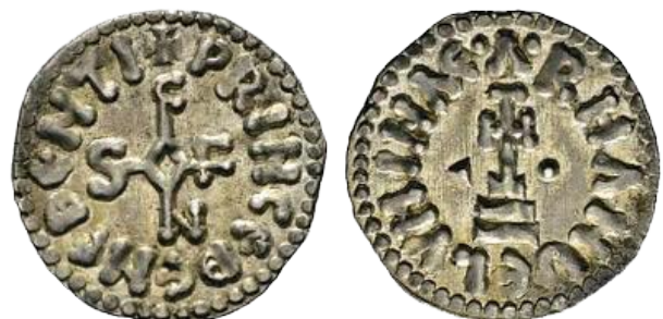
Fig. 2 - Denaro di Siconolfo. D/ +PRINCE BENEVENTI; al centro il monogramma del principe. R/ •A•RHANGELV MIHAE; al centro croce potenziata su tre gradini, ai lati un triangolo e un globetto. ø 17 mm circa; 1 g circa. Bell. 3. Ex asta elettronica H. D. Rauch GmbH 12 - lotto 2152