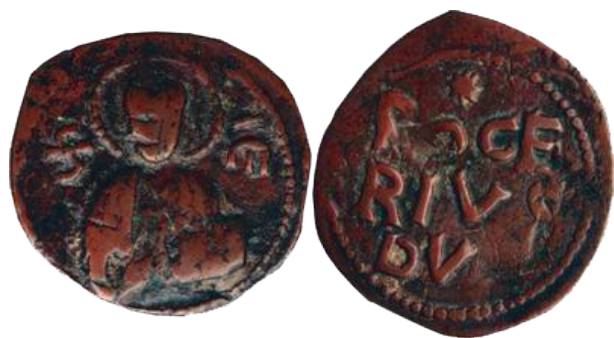
Fig. 3 - Follaro di Ruggero Borsa. D/ Busto di San Matteo tra le iniziali S e M. R/ Stella a otto punte, sotto legenda ROGERIVS DVX su tre righe. 24 mm circa; 2 g circa. Bell. 80, Trav. 86. Ex Stack's del 13/08/2013 - lotto 35055

Meno rappresentata è la monetazione normanna salernitana con una sola notizia da scavo, peraltro generica, di un follaro di Ruggero Borsa, figlio del Guiscardo, a Venosa; ma la recente segnalazione di ritrovamenti nell'area del Vulture offre interessanti spunti non solo per gli aspetti di circolazione monetaria ma anche relativamente alle tipologie oggetto di tali rinvenimenti. Si tratta, infatti, di possibili imitazioni di follari di Ruggero II, caratterizzate da uno stile più rozzo e peculiare rispetto alle emissioni ufficiali e più comuni. La moneta è presentata come una variante del follaro Trav. 177 per la particolarità del dritto, con il volto del sovrano frontale e avvolto