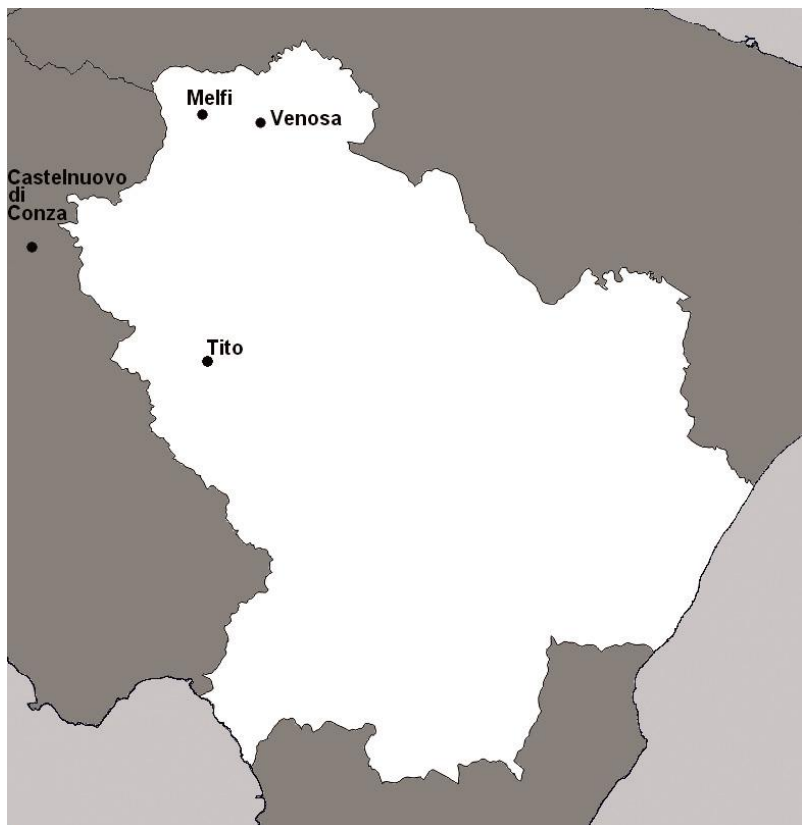
Fig. 4 - Mappa dei ritrovamenti