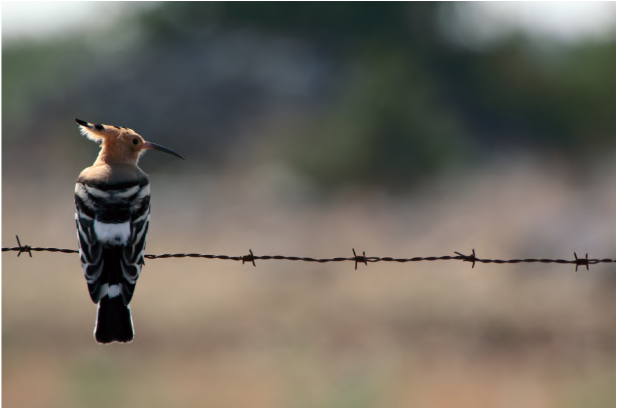
Fig. 4 - Upupa, Parco della Murgia Materana, agosto