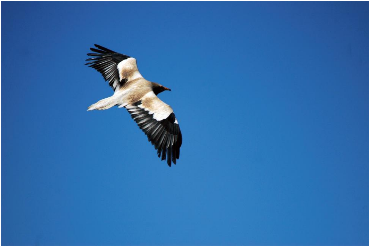
Fig. 3 - Capovaccaio, Parco della Murgia Materana, aprile