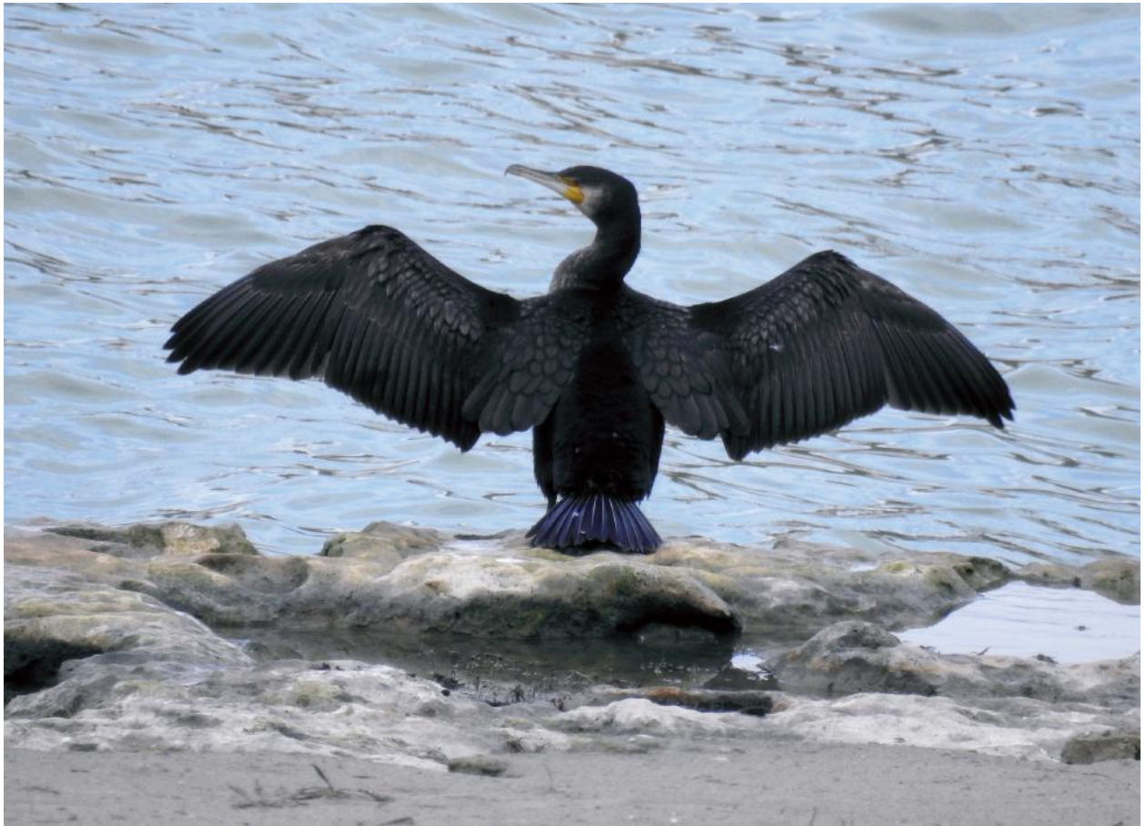
Fig. 7 - Cormorano, Riserva Naturale di San Giuliano, ottobre