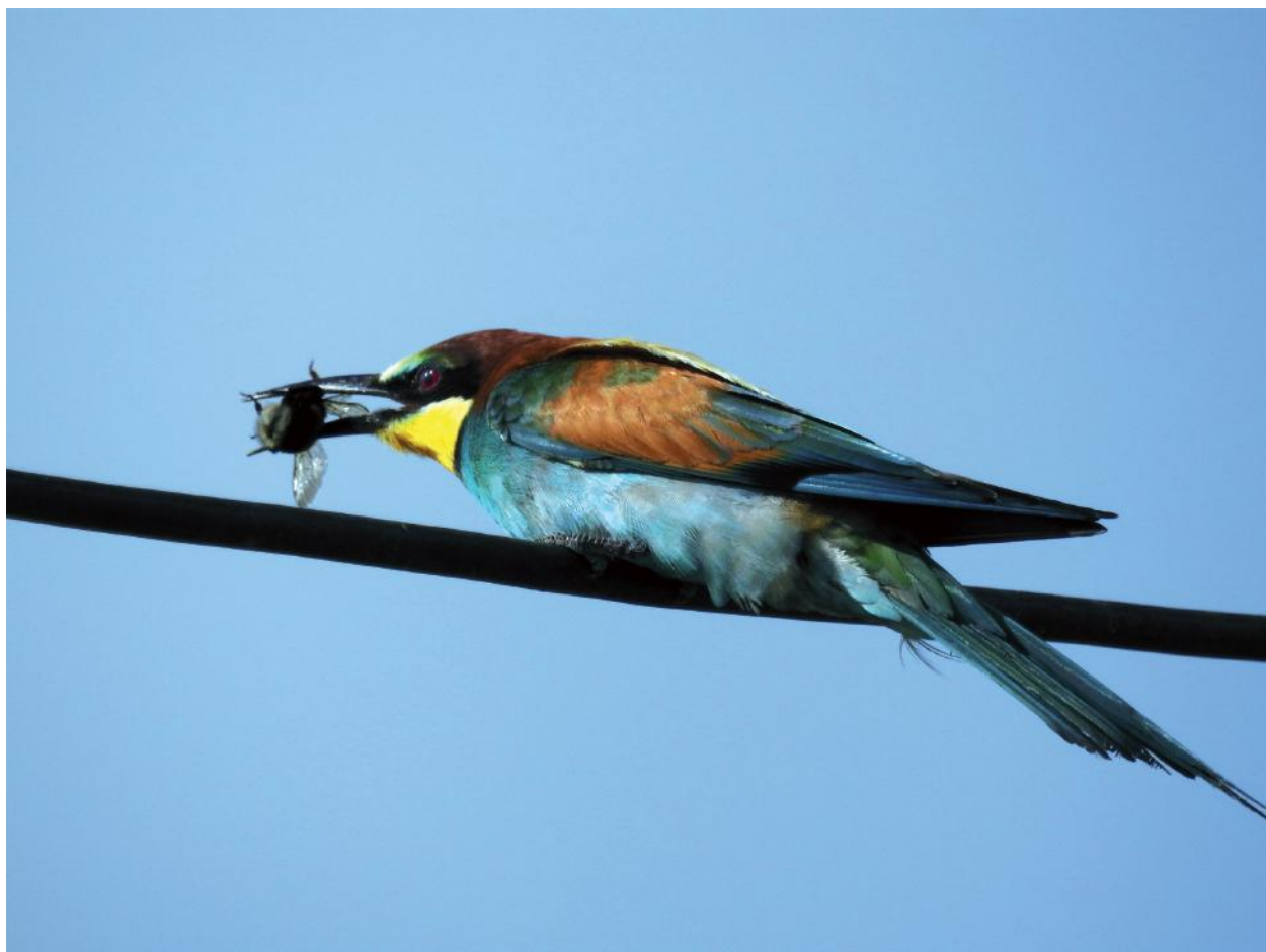
Fig. 5 - Gruccione con preda, Montescaglioso, maggio