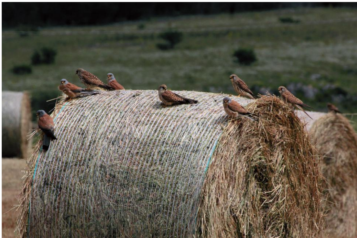
Fig. 6 - Grillai (su balle di fieno), Murgia materana, maggio