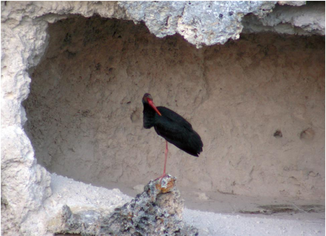
Fig. 9 - Cicogna nera, Parco della Murgia Materana, marzo