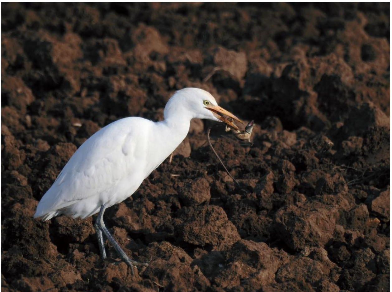
Fig. 8 - Airone guardabuoi, Riserva Naturale di San Giuliano, dicembre