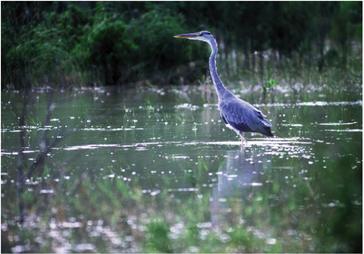
Fig. 1 - Airone cenerino, Riserva Naturale di San Giuliano, maggio