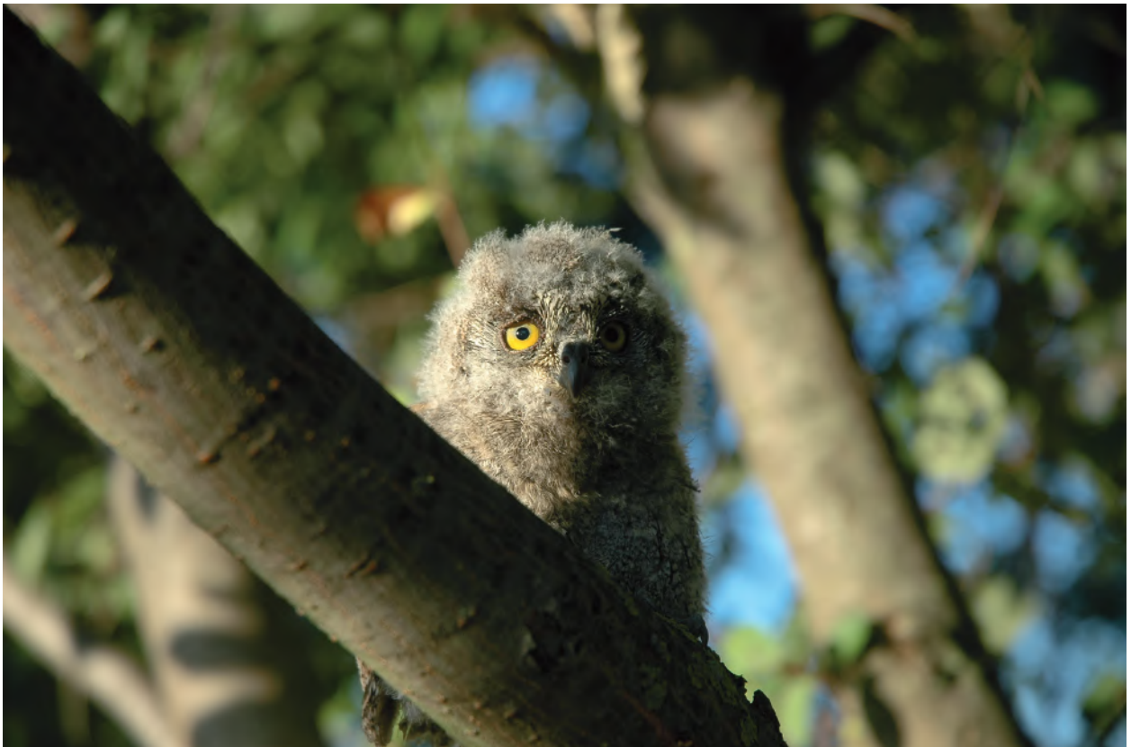
Fig. 2 - Assiolo (pullus), Riserva Naturale di San Giuliano, giugno