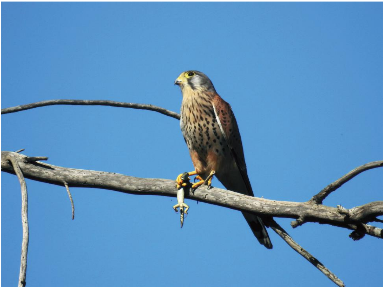
Fig. 10 - Gheppio, Riserva Naturale di San Giuliano, marzo