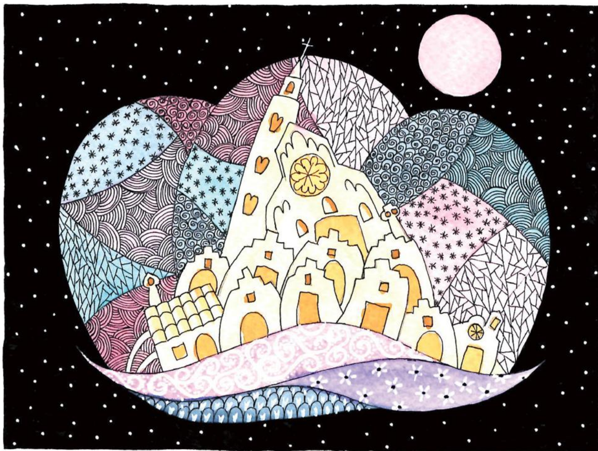
Disegno di Gabriella Papapietro, acquerello e inchiostro su carta

un nuovo spirito dei tempi. Hai scritto dell'importanza del recupero delle origini e della necessità di fare la rivoluzione. Gli asfodeli non li hai nominati. Abbiamo fatto le valigie e siamo andati a Roma. Non mi sono girata nemmeno una volta. È passata una vita, sempre insieme. Perfetti come quei giorni non ne abbiamo più vissuti. Siamo stati bene, ma sulla luna era un'altra cosa. Lì avevi avuto i tuoi vent'anni: ti avevo portato i miei in dote, visto che soldi non ne avevo, e ti avevo fatto felice. Certo, a Roma abbiamo avuto tre figli e cambiato due case, del tuo giornale comunista sei diventato direttore e poi cassaintegrato, la vita si è presa quello che ha potuto e qualcosa ci ha dato in cambio. Dei giorni di luna non abbiamo più parlato. Avremmo litigato di sicuro, perché i ricordi delle coppie non si somigliano mai. Ho prenotato una matrimoniale e precisato che mio marito tiene molto a una bella vista, mi hanno chiesto se era la prima volta che andavamo a Matera, ho risposto di sì, mi hanno assicurato che ci piacerà. Una volta che mi vedranno arrivare da sola qualcosa inventerò. Vedova è una così brutta parola.