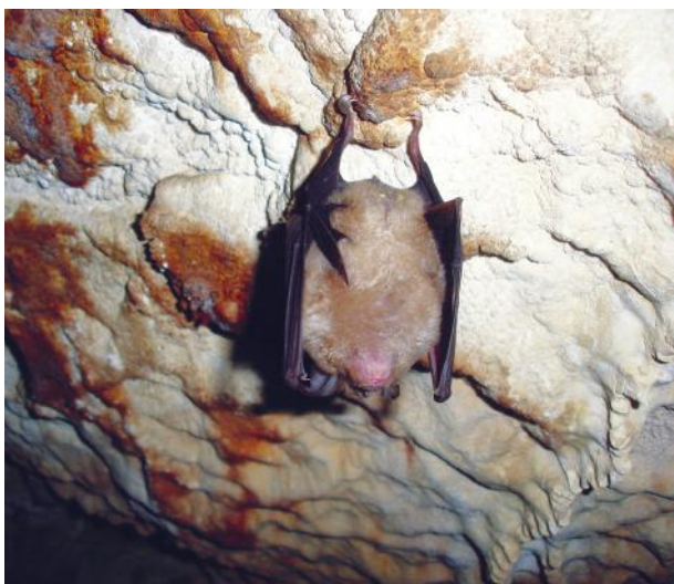
Matera, Pipistrello ferro di cavallo nella Grotta della Femmina

Uno dei compiti più suggestivi e invitanti - ma non privi di rischi e di mete illusorie -, affidati alla indagine linguistica, è rivolto alla interpretazione delle parole, esaminate nella loro variegata composizione, per rilevarne le differenti forme impiegate per esprimere uno specifico concetto.